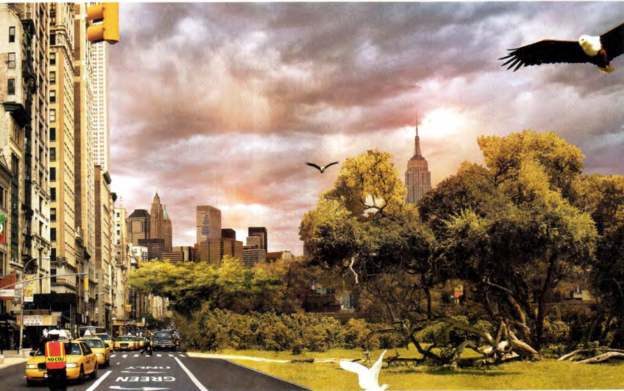
Anke Schaffelhuber, Green, C-Prints auf Alu-Dibond gedruckt hinter Acrylglas, 2,00 x 1,20 m

Es sind überdimensionale und detailverliebte digitale Fotografien von bis zu 2,7 Metern Breite und zwei Metern Höhe. Man sieht auf ihnen die in Wolken gehüllte Skyline von New York im Sand einer Wüste von Botswana stehen. Man sieht den Fuß des Eiffelturms, der vor der Kulisse patagonischer Eisberge prangt. Oder man sieht eine prachtvolle Straße, die aus einer Großstadt hinausführt in das Nichts der Wüste.