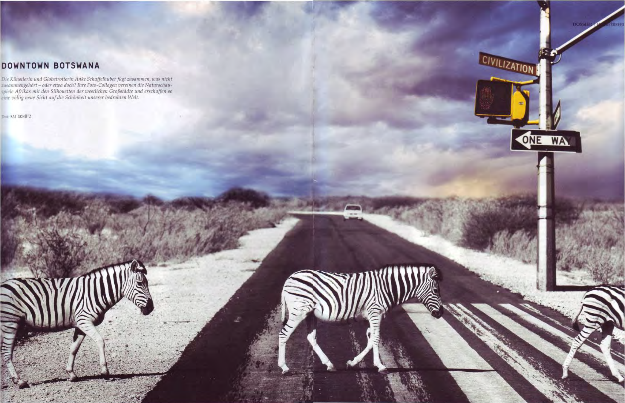
Anke Schaffelhuber, Zebra Crossing, C-Prints auf Alu-Dibond gedruckt hinter Acrylglas, 1,80 x 1,02 m